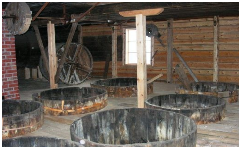
Märkäverstaas Portaan Nahkurinverstaalla. http://www.nahkurinverstaas.fi/

Suutarinverstaalla tehtiin myös rukkasia ja satulasepän töitä, joissa käytettiin suutarin työkaluja. Satulasepät tekivät pääasiassa hevosaluja ja muita hevosaluja, kuten päitsiä ja kuolaimia sekä silavaljaita. Nahkaan saatiin erilaisilla reikäraudoilla tehdyksi reikiä heloja ja niittejä varten. Satulaseppä käytti työssään myös ompelupihtiä, joka oli noin metrin mittainen pihti, jota yhdisti metallisarana. Ommeltavat nahkat asetettiin pihdin leukojen väliin ja leuat puristettiin polvilla yhteen, jolloin nahkat saatiin ommeltua kiinni toisiinsa pikilangalla. Satulasepällä oli myös omalaatuinen veitsi nahkan ja hihnojen leikkaamista varten. Veitsen terä oli puolikuun muotoinen ja sillä leikattiin nahkaa edestakaisella liikkeellä.